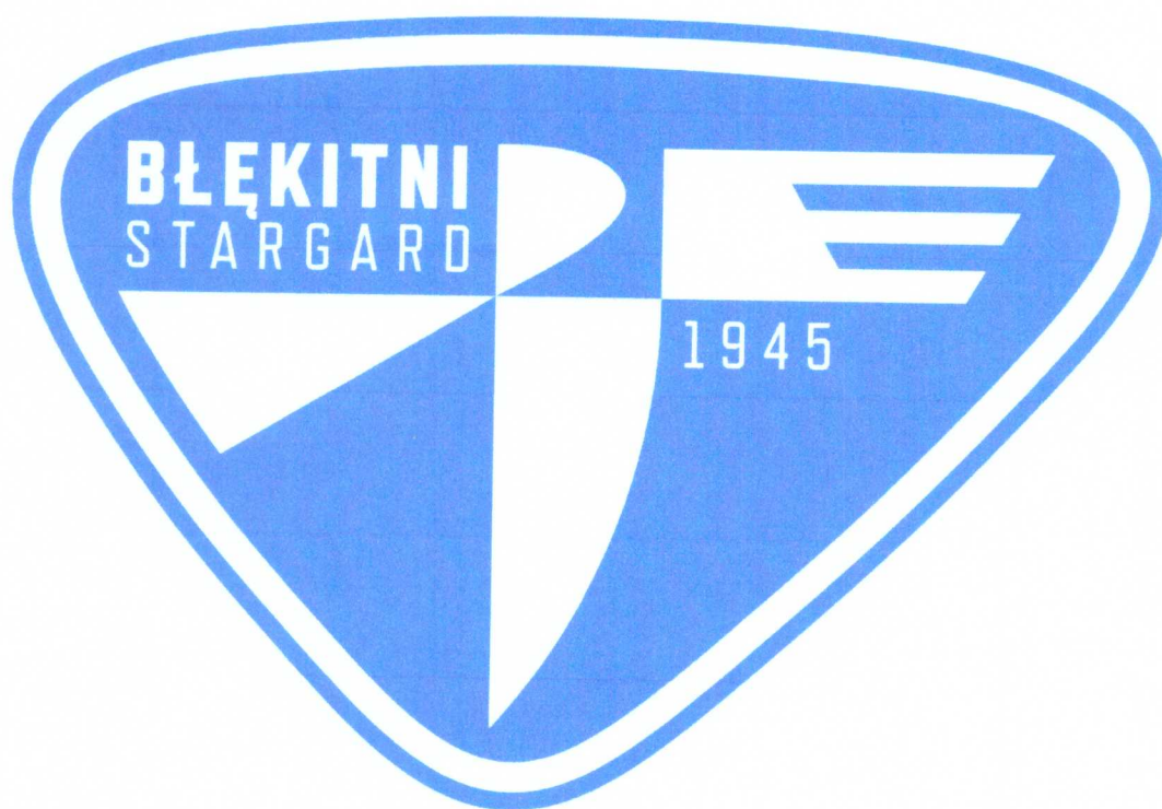
Oficjalne Logo Klubu Piłkarskiego Błękitni Stargard